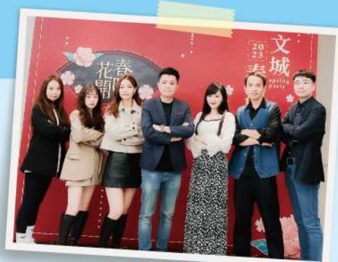
集思國文超強師資群