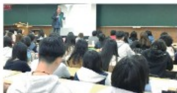
學習歷程檔案講座