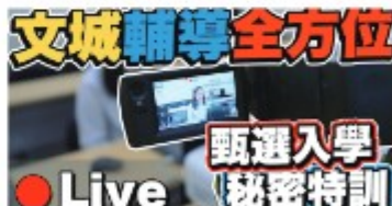
文城輔導全方位！大學教授親臨指導？ 甄選入學秘密特訓 Live!