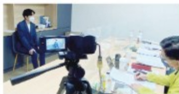
三對一模擬面試（同步錄影）