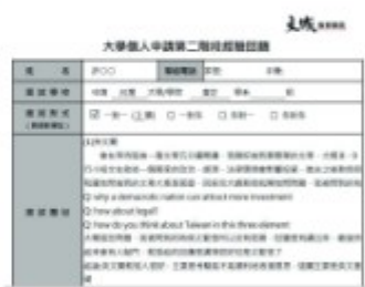
各校系面試考古題+學長姐經驗回饋

現場將以3(教授)對1(學生)團體的方式進行，現場評比，即時回饋，結束後發給學生面試錄影DVD及考核表，考核表上紀錄模擬面試時的優缺點，幫助同學了解自己面試時的狀況。