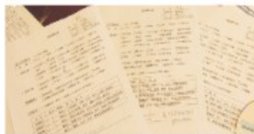
領取考核表，雲端觀看面試過程