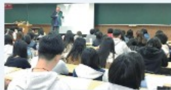
學習歷程檔案講座