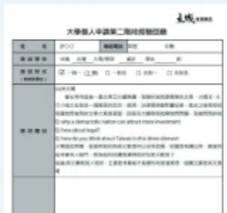
各校系面試考古題+學長姐經驗回饋

模擬面試 現場將以3(教授)對1(學生)團體的方式進行，現場評比，即時回饋，結束後發給學生面試錄影DVD及考核表，考核表上紀錄模擬面試時的優缺點，幫助同學了解自己面試時的狀況。