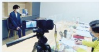
三對一模擬面試(同步錄影)