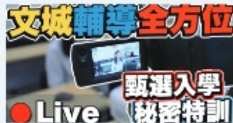
文城輔導全方位! 大學教授親臨指導? 甄選入學秘密特訓 Live!