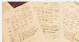
領取考核表, 雲端觀看面試過程