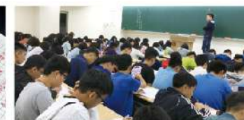
國寫實戰教學與演練