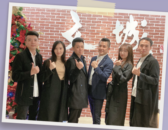
集思國文超強師資群

語言能力直接影響任何學科的學習效率與成效，舉凡記憶、擷取、理解、分辨、組織、統整、聯想、創造等，都是奠基於語文理解能力的基礎，閱讀理解更是直接關乎數理邏輯思考。